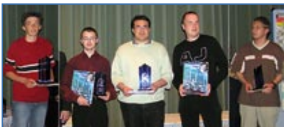
Deutsche Meister 2005