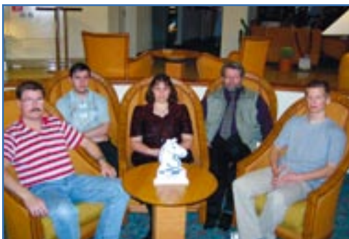
Deutsche Meister 2003