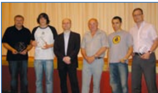
Die deutschen Meister 2007