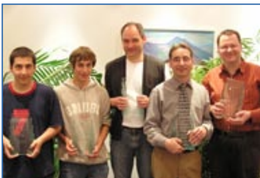
Die deutschen Meister 2006